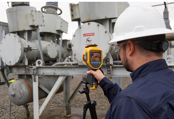
Afbeelding 1. Een controleur gebruikt de Fluke Ti450 SF 6 gasdetector voor het controleren van boutverbindingen.

Apparatuur van onderstations, zoals stroomonderbrekers en transformatoren, zorgen voor het schakelen en omvormen van hoge spanningen en stromen. Het schakelen van dergelijk hoge spanningen betekent een veiligheids- en productierisico vanwege een mogelijke boogontlading. In deze apparatuur wordt SF 6 -gas gebruikt voor isolatie. Dit broeikasgas is een efficiënter alternatief voor isolatoren zoals lucht en olie, vanwege de ioniserende eigenschappen als blusgas. Omdat het echter een krachtig broeikasgas betreft, is het belangrijk ervoor te zorgen dat in geval van een gaslek dit lek wordt gedetecteerd en op de juiste wijze wordt verholpen.