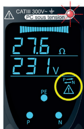
Ecran bleu: tout est ok