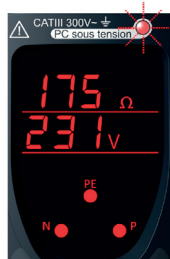
Ecran rouge: non conforme