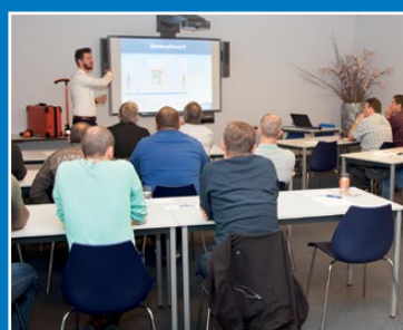
Séminaires et ateliers