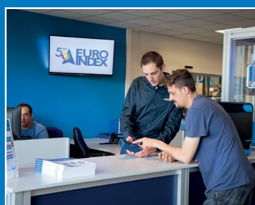
Guichet des services

Visionnez la vidéo sur notre chaîne YouTube et découvrez tout ce qu'il vous faut savoir sur MQS