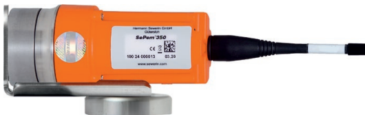
Fig.3 : Logger sur l'adaptateur de montage

L'adaptateur de montage est composé d'une tôle incurvée en acier inox avec un trou longitudinal et d'un adaptateur de contact. L'adaptateur de contact peut être glissé dans le trou longitudinal jusqu'à ce que la position optimale pour le point de mesure soit obtenue. Enfin, l'adaptateur de contact est vissé avec un écrou. Le logger est fixé au morceau de tôle court.