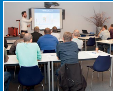
Seminars en workshops