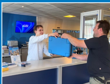
Comptoir de service