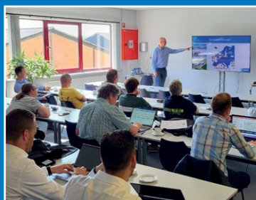
Trainingen en seminars