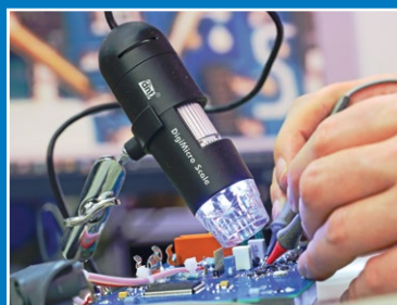
Onderhoud, reparatie en kalibratie