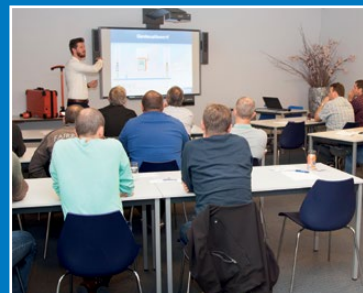
Seminars en workshops