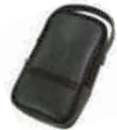
9079 Soepele draagtas