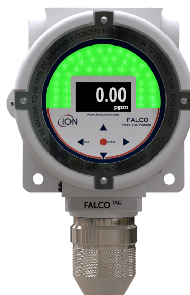
Modèle TAC diffus (10,0eV)