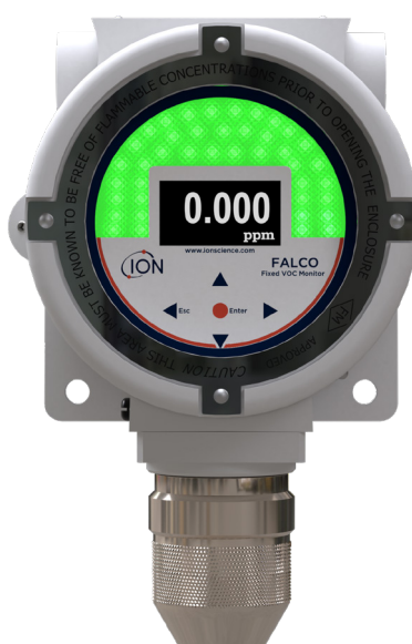
Modèle 10,6 eV diffus

L'enregistrement de votre produit en ligne dans un délais d'un mois après votre achat, permettra de prolonger sa garantie. Visitez ION Science.