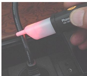
AC Voltage detection