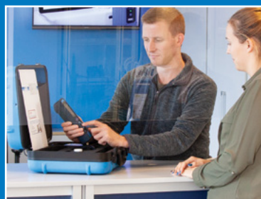
Comptoir de service