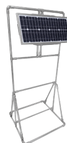
SolarPak oplaadapparaat (optioneel)