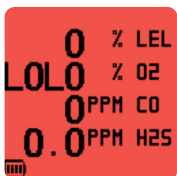
Rode display in alarmcondities