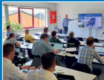
Trainingen en seminars