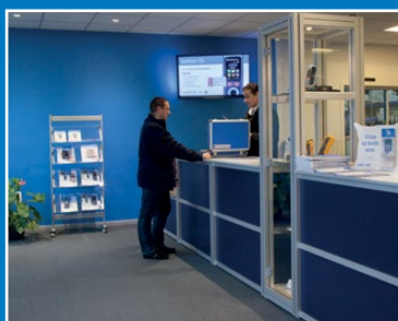
Guichet des services

Visionnez la vidéo sur notre chaîne YouTube et découvrez tout ce qu'il vous faut savoir sur MQS