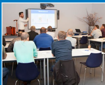
Séminaires et ateliers