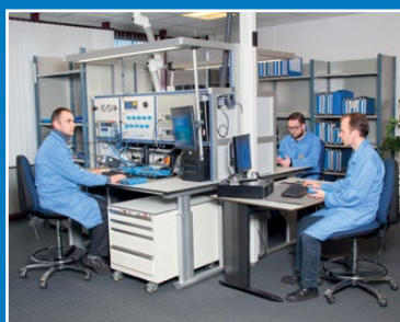
Calibrage de l'analyse de gaz de combustion