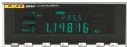
Gebruik de insteltoetsen (S1-S6) voor snelle toegang tot herhaalde metingen. Er kan een functie met pass/fail-indicatoren voor vergelijking met grenswaarden worden ingesteld