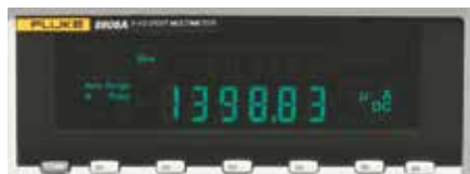
De Fluke 8808A heeft twee lage stroombereiken met lage impedantie voor het meten van lekstromen