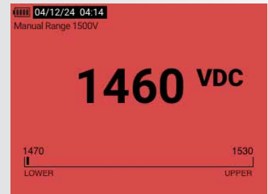
Limietmeter - buiten bereik