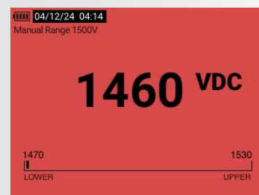
Jauge de limite : hors plage