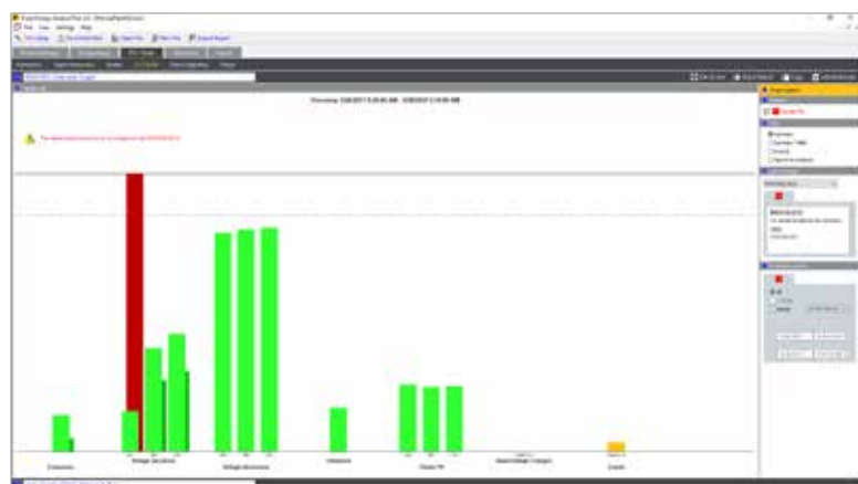
Fluke Energy Analyze Plus : résumé de l'état de la qualité du réseau électrique