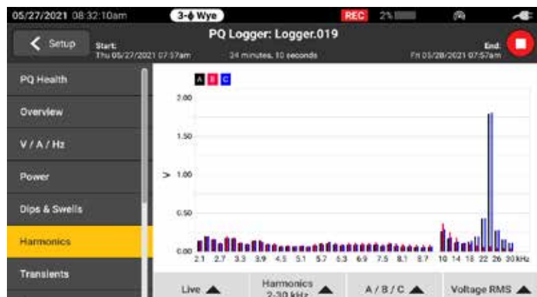
Gamme complète d'harmoniques disponible à partir des 50 premiers harmoniques entiers et de 2 kHz à 30 kHz

La série Fluke 1770 a été conçue pour être sûre et facile à utiliser dans n'importe quel environnement de mesure. La série 1770 vous permet de capturer une gamme complète de variables de qualité du réseau électrique, mais aussi des formes d'onde et transitoires haute vitesse, ainsi que des harmoniques à haute fréquence, que vous pouvez visualiser instantanément sur le grand écran haute résolution. Dotés de la meilleure valeur de surtension CAT IV 600 V/CAT III 1000 V de sa catégorie, ces analyseurs peuvent être utilisés en amont ou en aval du service, pour mesurer les entrées AC et DC et les harmoniques jusqu'à 30 kHz. Avec la série 1770, vous êtes assuré de capturer les données dont vous avez besoin pour prendre de meilleures décisions de maintenance, quelle que soit la tâche concernée.