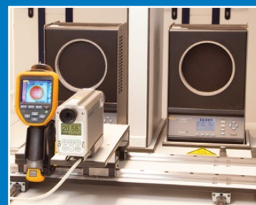
Calibrage de la thermographie

Sous réserve de modifications EURO-INDEX® FR 18001