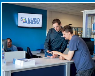
Guichet des services

Visionnez la vidéo sur notre chaîne YouTube et découvrez tout ce qu'il vous faut savoir sur MQS