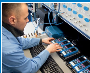
Calibrage de l'analyse de gaz de combustion