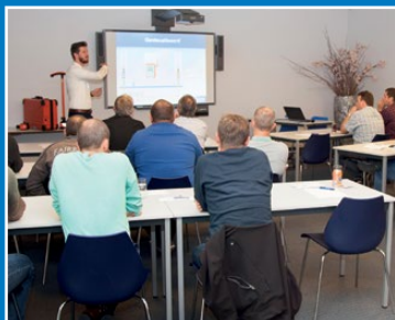
Séminaires et ateliers