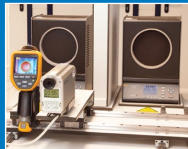
Calibrage de la thermographie

Sous réserve de modifications EURO-INDEX® FR 18001