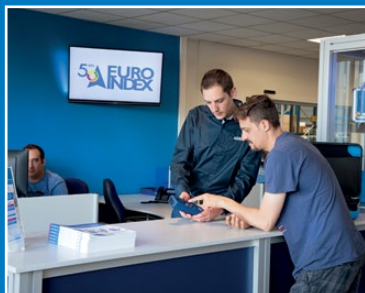
Guichet des services

Visionnez la vidéo sur notre chaîne YouTube et découvrez tout ce qu'il vous faut savoir sur MQS