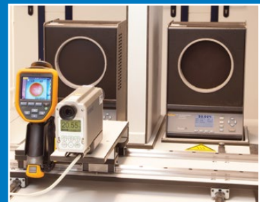
Calibrage de la thermographie

Sous réserve de modifications EURO-INDEX® FR 18001