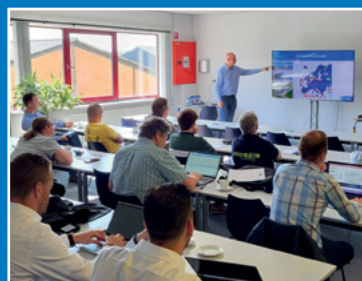
Trainingen en seminars