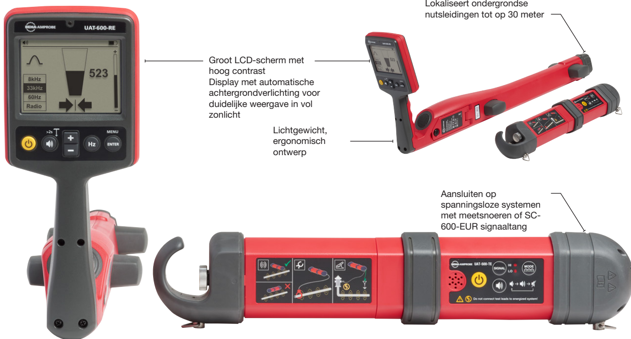
UAT-505-EUR Kit voor opsporen van ondergrondse nutsvoorzieningen