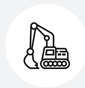
Onderhoud van buitenfaciliteiten