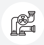
Water, afvalwater en riolering