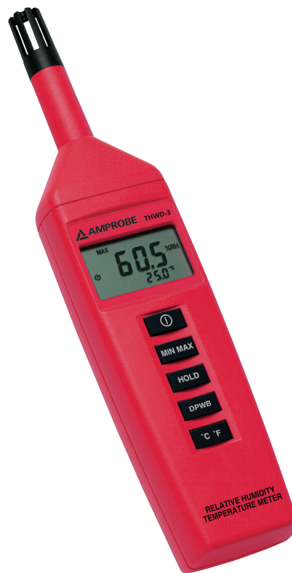
THWD-3 Relative Humidity Temperature Meter

All Amprobe tools, including the Amprobe THWD-3, are rigorously tested for safety, accuracy, reliability, and ruggedness in our state-of-the-art test lab. In addition, Amprobe products that measure electricity are listed by a 3rd party safety lab, either UL or CSA. This system assures that Amprobe products meet or exceed safety regulations and will perform in a tough, professional environment for many years to come.