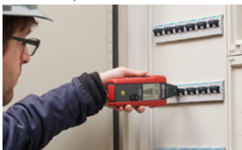
Identification du seul disjoncteur correct