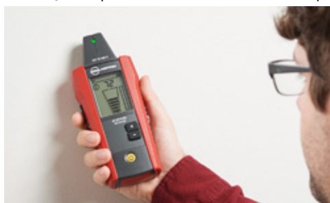
Localisation des câbles sous et hors tension

REMARQUE : Reportez-vous au manuel d'utilisation pour consulter les spécifications des accessoires.