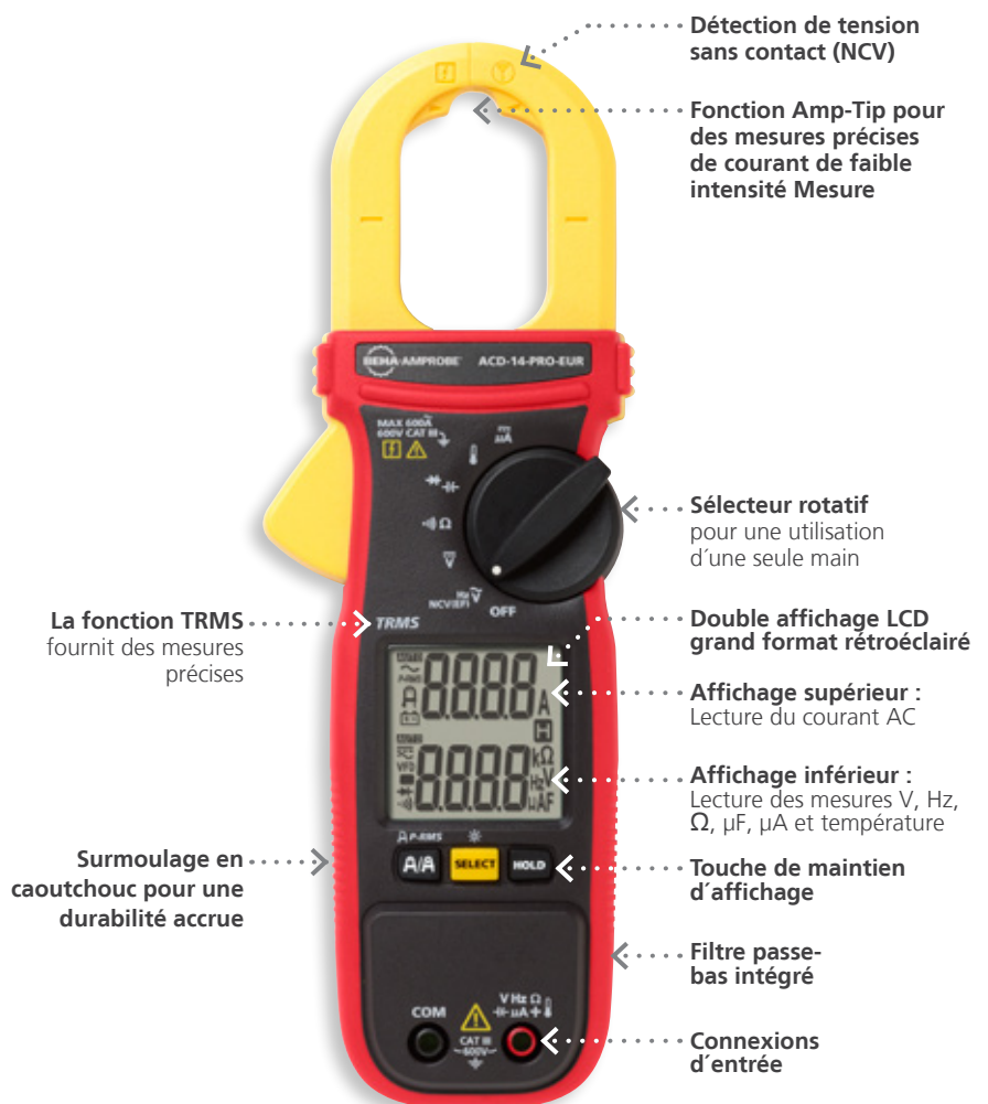
ACD-14-PRO-EUR Pince multimètre TRMS 600 A à double affichage