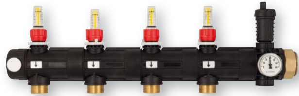
ProCalida® IN 1½

Modular plastic manifold for industrial or geothermal applications with up to 20 heating circuits. Return either with stroke valves for actuators or with shut-off valves, flow either with shut-off valves or with flow meters as required. Main connection with union nut G1½. Individual installation of filling and drain valve, quick air vent, pressure gauge and thermometer via multi-way union. Easy snap-on mounting of manifold on wall bracket.