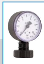
Manometer RF 50 - 0/10 bar