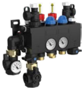
ProCalida CC 1