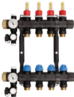
ProCalida EF 1