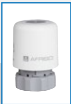
Thermostatische aansturing TSA-02/03