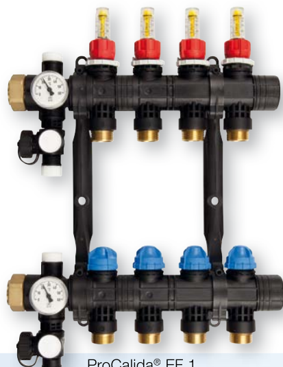
ProCalida® EF 1

Medium: Max. 60 °C at 6 bar or max. 90 °C at 3 bar