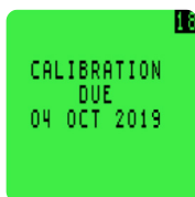
Ecran de configuration d'appel au calibrage