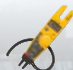
Testeurs pince ouverte à technologie FieldSense™*