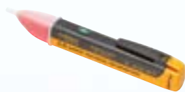
Repérage de phase